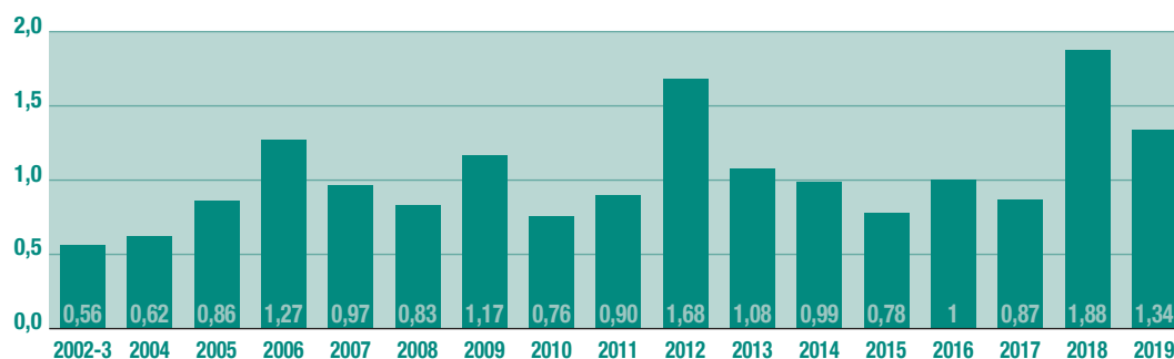
Tasa detección casos/1.000 nenos: Anos 2002-2019

A taxa de detección no período 2002-2019 é de 1,05 por mil nenos cribados. No ano 2019 a taxa de detección foi do 1,34 por mil nenos cribados.