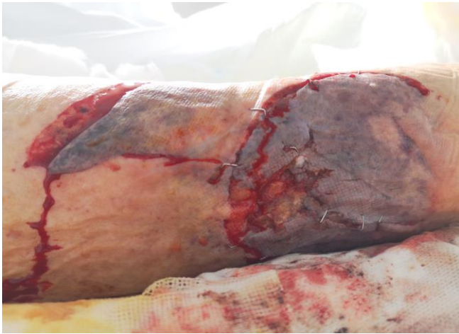
Imagen 1: Herida traumática de partes blandas en una pierna (imagen cedida por los autores).

En la práctica, en un traumatismo mecánico se combinan alteraciones funcionales con deformaciones morfológicas, dando lugar a dos tipos de lesiones traumáticas: