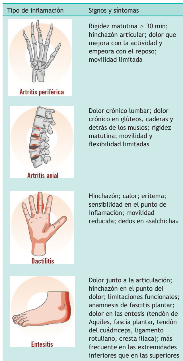
Tabla 3 Características clínicas de la artritis inflamatoria, entesitis, dactilitis y espondilitis o dolor axial 7

las articulaciones interfalángicas distales) para comprobar una posible inflamación periférica, a las entesis —como la del tendón de Aquiles— para comprobar posibles entesitis, a los dedos (sobre todo de los pies) para comprobar posibles dactilitis, y a la columna vertebral para valorar la presencia de dolor axial inflamatorio.