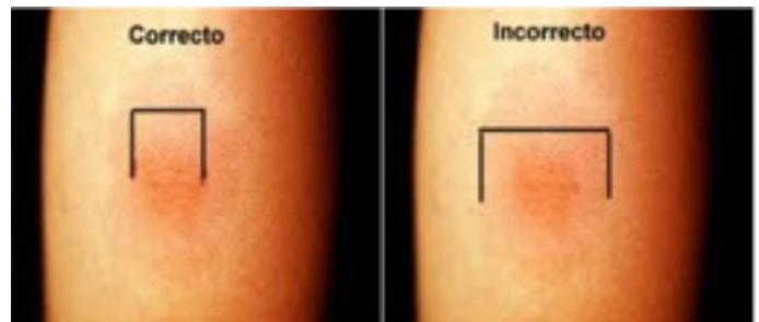
/ Lectura da intradermorreacción