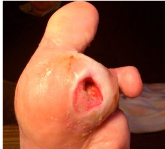
Figura 4. Úlcera grao 3

Conforme as lesións son de grao superior, aumenta a posibilidade de sufrir unha amputación maior e aumenta, así mesmo, a mortalidade asociada. As principais limitacións desta escala serían: