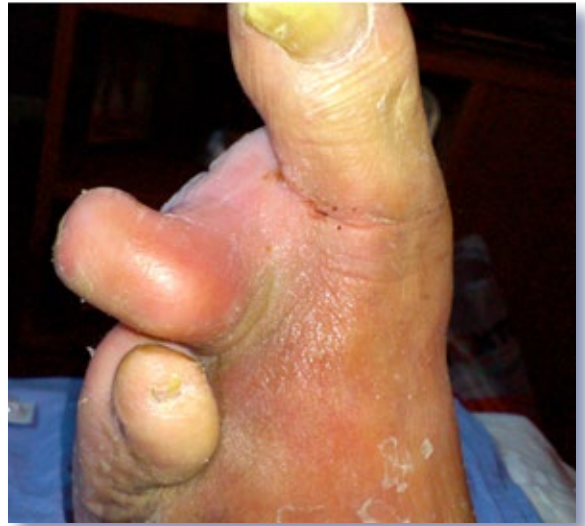
Figura 6. Signos de infección no segundo dedo do pé