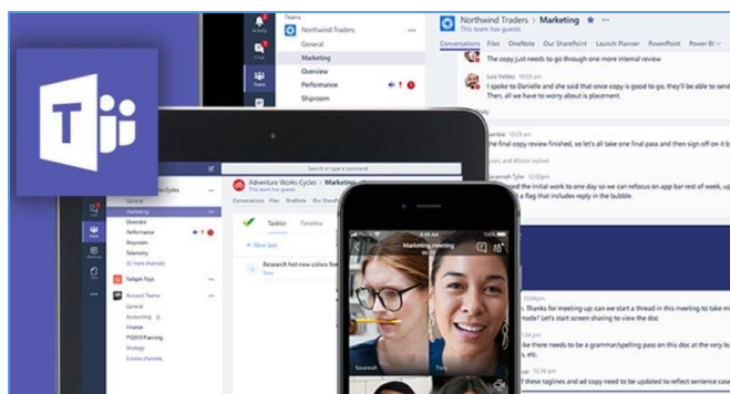
Imagen 8: Aspecto de una videoconferencia a través de Teams. (Fuente imagen: sitio.com ).

Es el producto de Microsoft para videollamadas (Imagen 8). También dispone de una versión gratuita que permite reuniones de hasta 300 participantes durante 60 minutos, aunque en la página se advierte que estos son los límites permitidos hasta el 30 de junio de 2021. Es posible compartir escritorio y archivos. Tiene opción de chat y por supuesto trabajar en equipo con todos los productos de Office® en tiempo real. La creación de informes completos de reunión sólo está disponible en las versiones de pago.