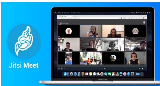
Imagen 4: Aspecto de una videoconferencia a través de Jitsi Meet.

Es una aplicación gratuita de software libre, es decir, su código fuente puede ser estudiado, modificado, y utilizado libremente con cualquier fin y redistribuido con cambios o mejoras (4) . Jitsi permite integraciones con plataformas tan potentes como Microsoft, Google o Slack. También ofrece interesantes servicios como grabar las sesiones o generar estadísticas. Es una buena opción para reuniones, pero si lo queremos utilizar para actividades formativas tendría que ser con grupos muy reducidos porque tan solo admite 8 participantes por reunión (Imagen 4).