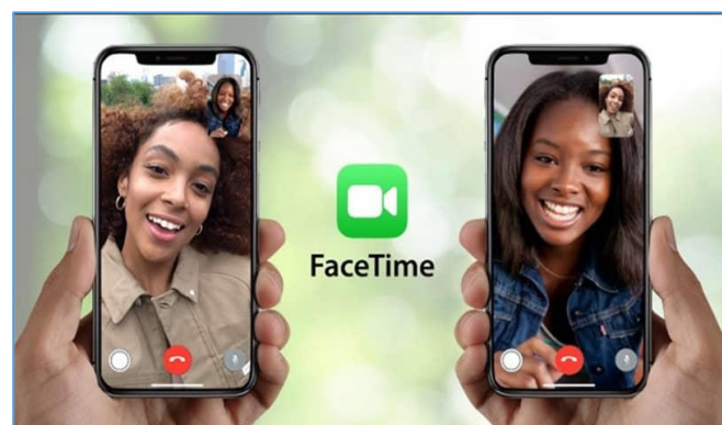
Imagen 9: Aspecto de una videollamada a través de FaceTime.

Es la aplicación de videollamadas de la compañía Apple (Imagen 9). Es gratuita pero sólo está disponible para dispositivos de esta marca. Permite grupos de hasta 32 personas. De los productos analizados hasta el momento, el más parecido a FaceTime es Whatsapp, aunque FaceTime es más completo, puesto que dispone de versión para ordenador, permite utilizar tanto la cámara trasera como la delantera en los dispositivos móviles y también compartir capturas de pantalla.