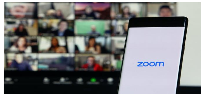
Imagen 6: Aspecto de una videoconferencia a través de Zoom. (Fuente imagen: images.theconversation.com ).

Durante el primer trimestre de 2020 se ha convertido en una de las aplicaciones de videoconferencia más utilizadas en todo el mundo. Tiene una versión gratuita y otras de pago. Zoom (Imagen 6) cuenta con planes especialmente adaptados a centros educativos. El plan gratuito permite reuniones de hasta 100 participantes durante un máximo de 40 minutos, sin embargo, actualmente no hay restricción de tiempo para centros educativos afectados por COVID-19. Zoom permite compartir archivos y escritorio, dispone de chat, admite varios moderadores, grabar sesiones e incluso transcribirlas, opción que, aplicada a la formación, es especialmente útil para que los alumnos puedan repasar una vez finalizada la clase. Otra opción que ofrece es un plan para el control de la salud, (5) dando a los servicios sanitarios la opción de utilizar los recursos y el hardware que ya tiene.