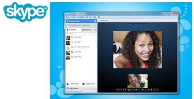
Imagen 5: Aspecto de una videoconferencia a través de Skype.

La función Skype Web (Imagen 5) permite conectarnos sin necesidad de descargar la aplicación, lo que convierte a esta plataforma en ideal para utilizarla en dispositivos ajenos, como un ordenador corporativo, donde no queremos instalar un software. Permite compartir escritorio y archivos, grabar llamadas y admite hasta 50 participantes, siendo una buena opción para actividades formativas. Tiene la interesante capacidad de subtitar las conversaciones en hasta 11 idiomas.