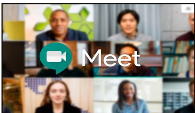
Imagen 7: Aspecto de una videoconferencia a través de Google Meet. (Fuente imagen: google.com ).

Recientemente la compañía Google ha sustituido su servicio Hangouts® por Meet (Imagen 7). Para utilizar este producto es necesario tener una cuenta de Google y la versión gratuita limita el tiempo de conexión a 60 minutos. Admite hasta 100 participantes en una misma llamada, pero en la pantalla se muestra un máximo de 16 personas. Es posible compartir el escritorio, pero para grabar las sesiones es necesario contar con un plan de suscripción. Una opción interesante son los subtítulos a tiempo real, lo que permitiría a personas con problemas de audición seguir fácilmente las sesiones. Sin embargo, esta opción de momento sólo está disponible en inglés.