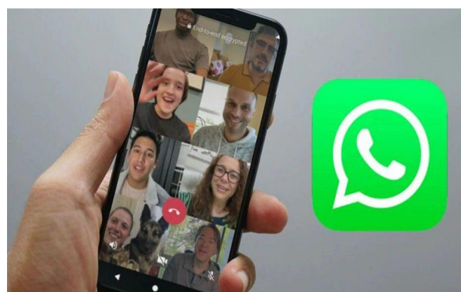
Imagen 1: Aspecto de una video llamada a través de Whatsapp.

Es quizá la aplicación más conocida y utilizada para hacer videollamadas desde un dispositivo móvil. Permite reuniones de hasta 8 personas y su manejo es realmente sencillo. (1) (imagen 1). Sin embargo, durante una videollamada no podremos compartir archivos y la versión para ordenador sólo permite la función chat. Whatsapp (imagen 1) es una buena herramienta de mensajería, pero muy limitada para organizar reuniones.