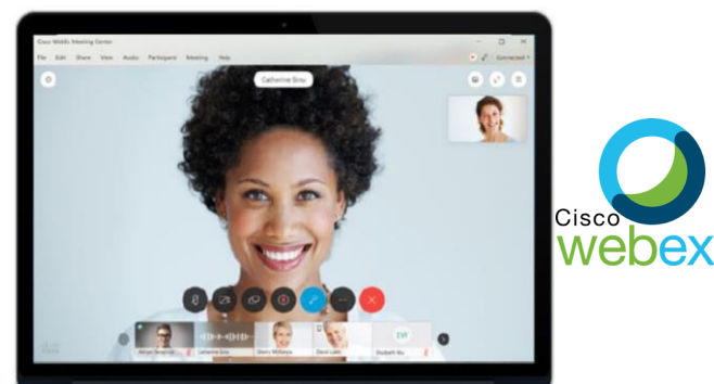
Imagen 10: Aspecto de una videollamada a través de Webex. (Fuente imagen: uctoday.com/ ).

Es un producto de la compañía Cisco, líder mundial en telecomunicaciones. Webex es uno de los productos más completos del mercado (Imagen 10), sin embargo, no existe una versión gratuita, pero podemos probarlo durante 90 días sin necesidad de pagar suscripción. Está pensado para organizar reuniones y trabajar en equipo, pero a distancia. Por supuesto permite compartir escritorio, grabar, enviar archivos y realizar estadísticas de uso. Uno de los aspectos más cuidados en este producto es la seguridad.