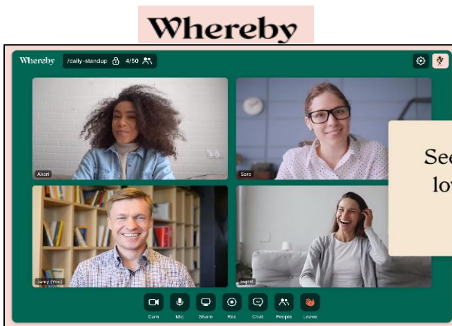
Imagen 3: Aspecto de una videoconferencia a través de Whereby.

Es una solución muy sencilla para convocar reuniones ya que no requiere instalar ningún programa o aplicación. Tiene una versión gratuita, pero como era de esperar, las opciones más interesantes solo están disponibles pagando una cuota (3) . Los administradores deciden quién puede unirse a la reunión de hasta un máximo de 50 personas (4 personas para la versión gratuita) (Imagen 3). Permite compartir escritorio y archivos. Dispone de chat y las sesiones se pueden grabar.