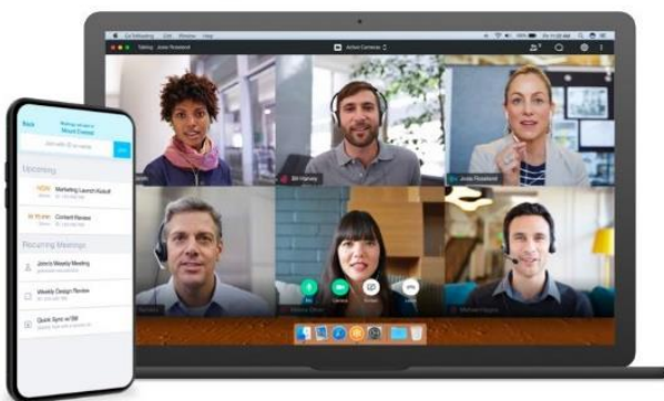
Imagen 11: Aspecto de una videoconferencia a través de GoTo-Meeting.