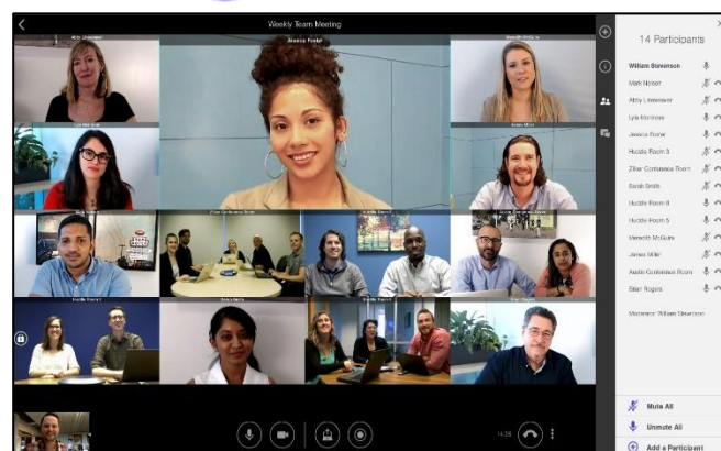
Imagen 2: Aspecto de una videoconferencia a través de Lifesize.