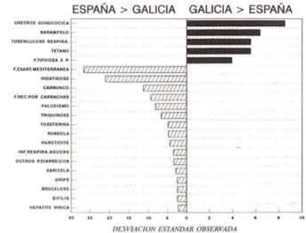
TÁBOA II. COMPARACIÓN DAS TAXAS DE INCIDENCIA DECLARADA EN GALICIA NO ANO 1991, COAS DE ESPAÑA E ASTURIAS